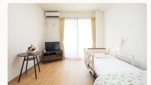
大きな収納もある明るい居室