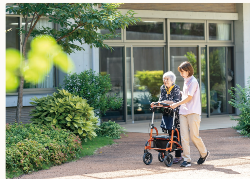
四季折々の草花が楽しめる中庭