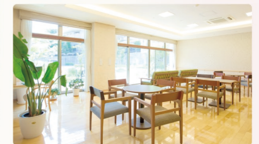
ご家族との歓談などに利用できるラウンジ